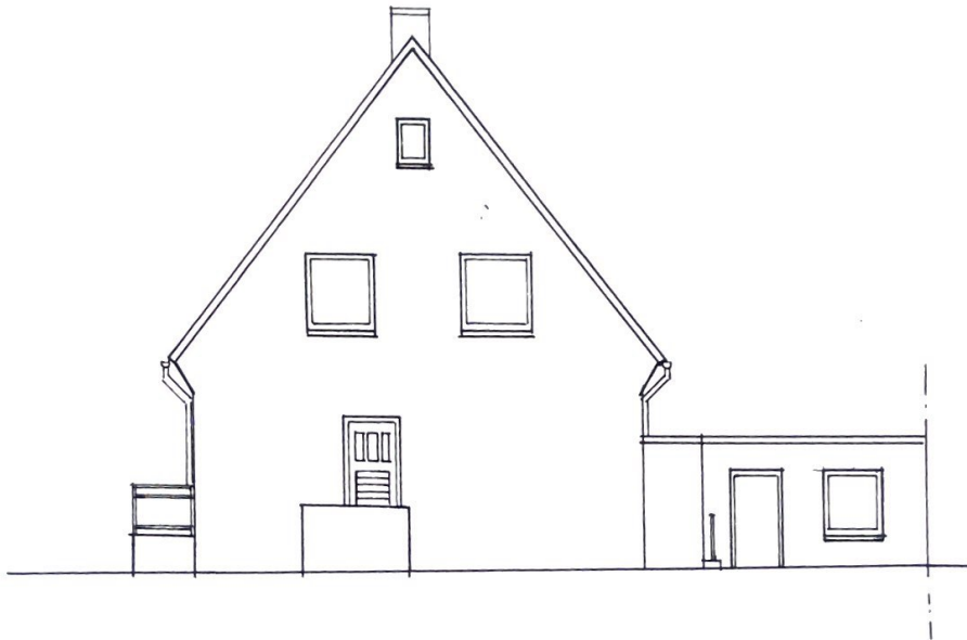
GARTENANSICHT M. 1 : 100

WOHNHAUS MIT GARAGE IN 41569 ROMMERSKIRCHEN-ANSTEL, LANGER BERG 15