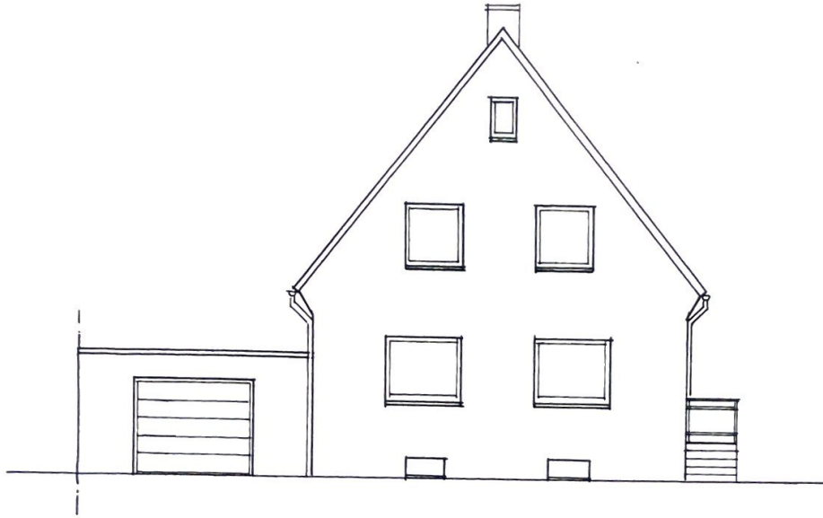
STRASSENANSICHT M. 1 : 100

EINFAMILIENWOHNHAUS MIT GARAGE M. 1 : 100 IN 41569 ROMMERSKIRCHEN-ANSTEL, LANGER BERG 15